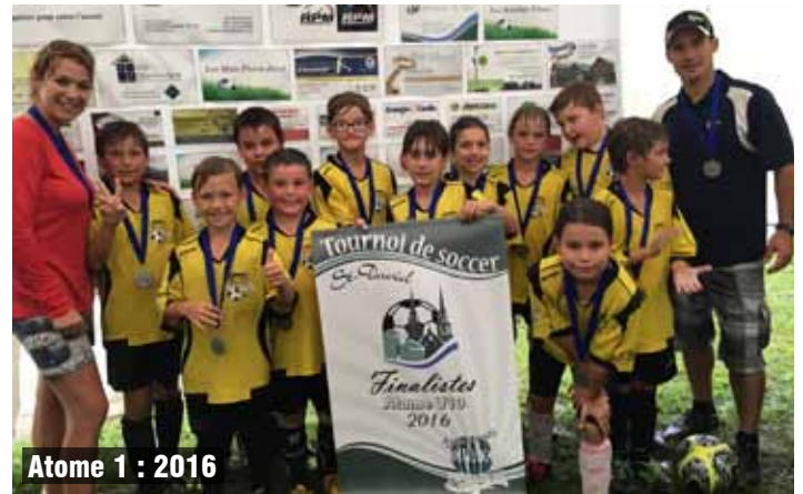
Atome 1 : 2016

Merci à tous les joueurs pour leurs efforts et à tous les parents pour vos encouragements.