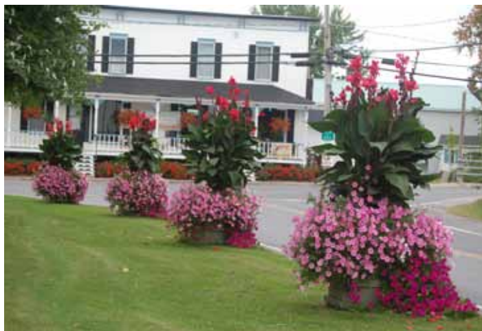
Le coeur du village