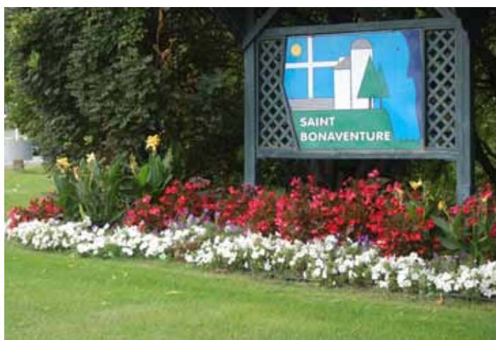
À l'entrée du village, route 143