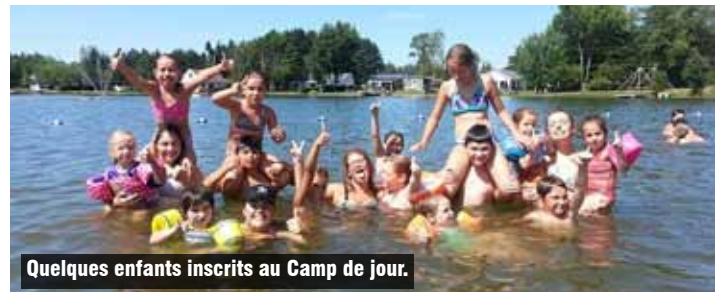
Quelques enfants inscrits au Camp de jour.

Nous espérons avoir l'occasion de vous revoir l'année prochaine et n'hésitez pas à nous faire part de vos commentaires et/ou idées de sorties pour la saison prochaine qui sera soulignée par le 150 e anniversaire de la municipalité.