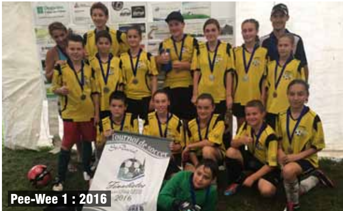
Pee-Wee 1 : 2016

être fiers de cette évolution constante. Notre moment marquant est sans aucun doute notre victoire contre St-David en demi-finale. Nous avons réussi à éliminer les favoris du tournoi qui avait une fiche de saison parfaite avec 11 victoires et 0 défaite. Vraiment extraordinaire! C'était